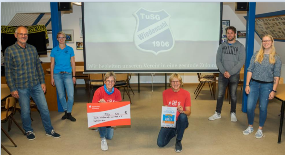
Abbildung 5

Bei der Ehrung durch den Kreissportbund Schaumburg e.V. wurde darüber hinaus das Bewerbungsvideo mit allen gesundheitsorientierten Sportangeboten des Vereins präsentiert. Wir wünschen weiterhin viel Erfolg und Leidenschaft im sportlichen Ehrenamt.