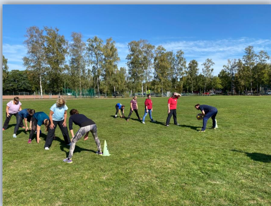
Abbildung 3

Die Fortbildung der Sportjugend Schaumburg fand am 19.09.2020 auf dem Sportplatz des Jahnstadions statt. Trotz der vielen Anmeldungen sind leider einige Teilnehmer kurzfristig aufgrund von Grippesymptomen ausgefallen. Dennoch konnte eine Palette von sportlichen Ideen für die Vereinspraxis erarbeitet werden.